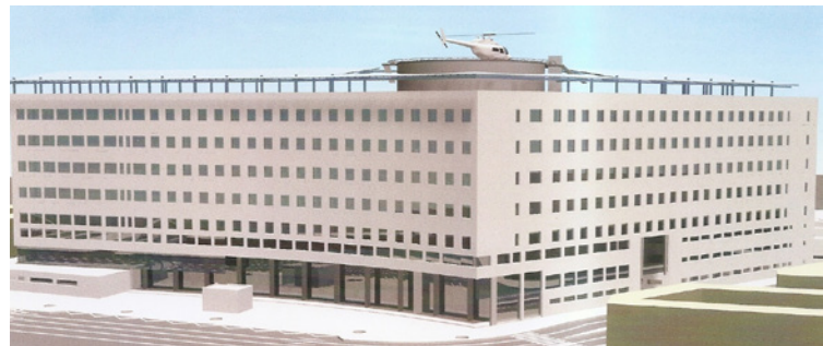
1. Hospital General Universitario Reina Sofía.

Tras cinco años de obras y una vez finalizadas, en enero de 2005 se inaugura el nuevo levantado en la avenida del Intendente Jorge Palacios a con la asistencia de su majestad la reina Sofía, de quien toma su nombre de Hospital General Universitario Reina Sofía (1) y pierde su