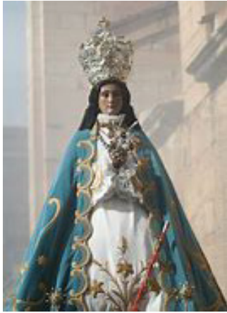
2. Imagen de la Virgen de la Inmaculada Concepción, patrona de Yecla.

llena (Alicante). Recibió el nombre de la patrona de Yecla, Residencia Sanitaria Virgen del Castillo de la Inmaculada Concepción (2) .