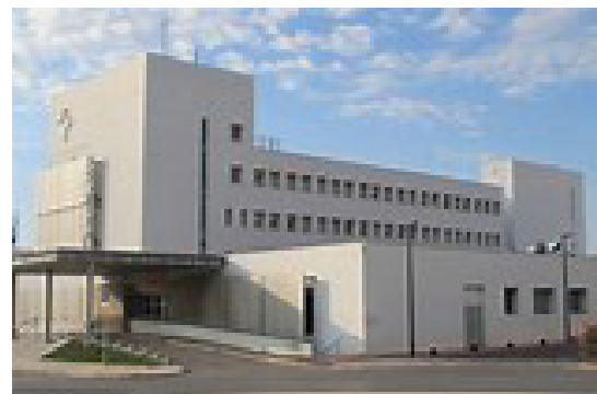
1. Hospital Virgen del Castillo.

Una vez entendida su necesidad por las autoridades se logró levantarlo y fue inaugurado en 1981 . Contaba con cien camas (1) para cubrir el área de salud V de la Región de Murcia correspondiente a la Comarca del Altiplano con las poblaciones de Yecla y Jumilla, y que en un principio se extendió a las limítrofes de Caudete (Albacete) y de Pinoso y Vi-